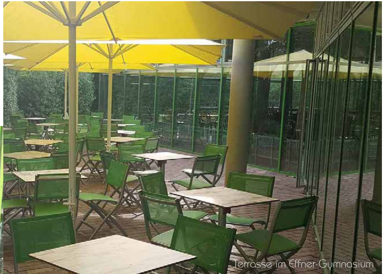
Terrasse im Effner-Gymnasium

Tisch klapp- und stapelbar je 1 Stück 68 x 68