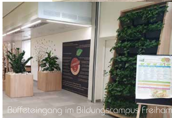
Pflanzenwand im Bildungscampus Freïham