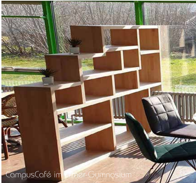
CampusCafé im Lärner-Gymnasium