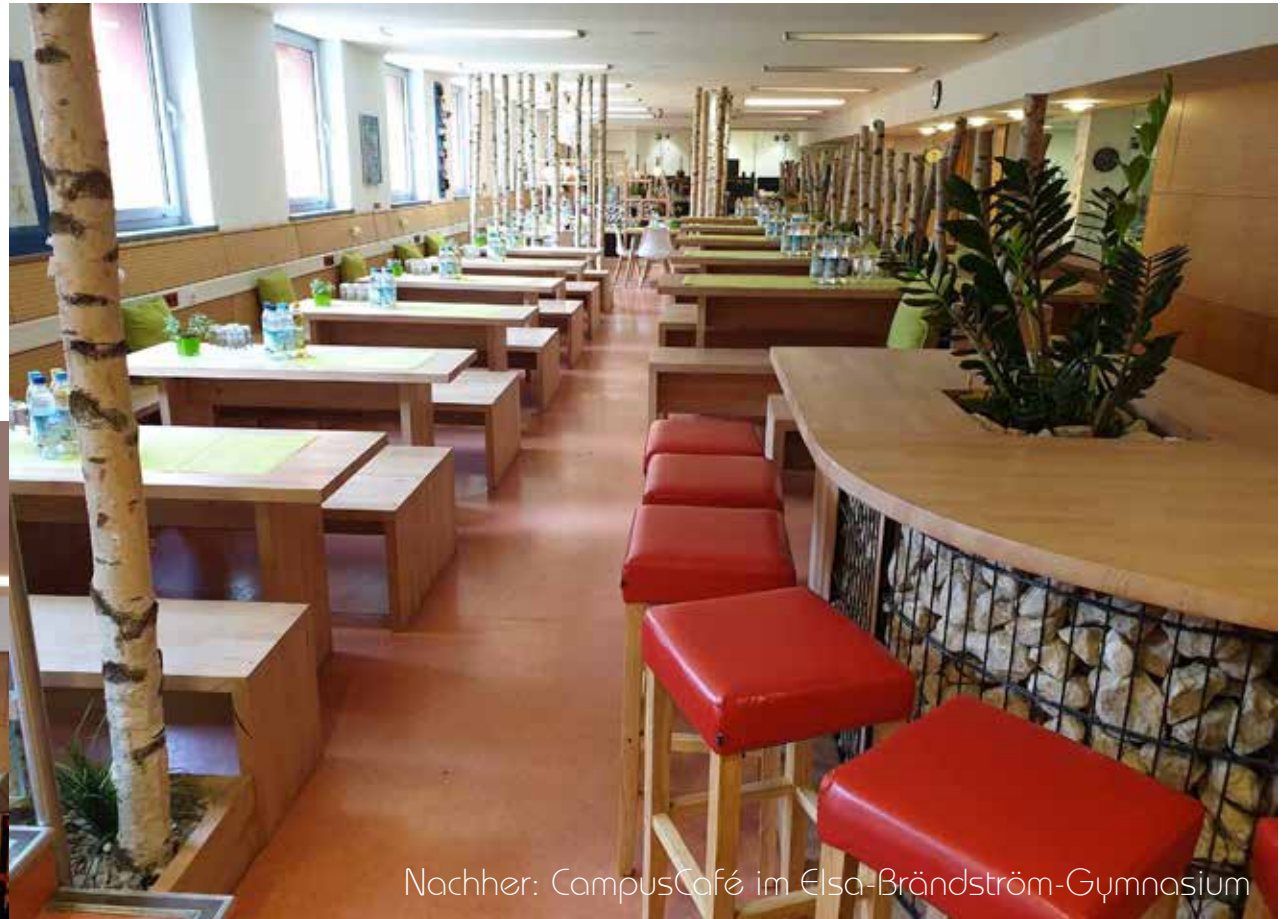
Nachher: CampusCafé im Elsa-Brändström-Gymnasium