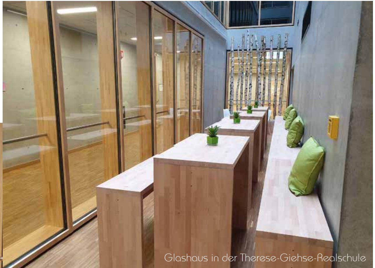
Glashaus in der Therese-Giehse-Realschule