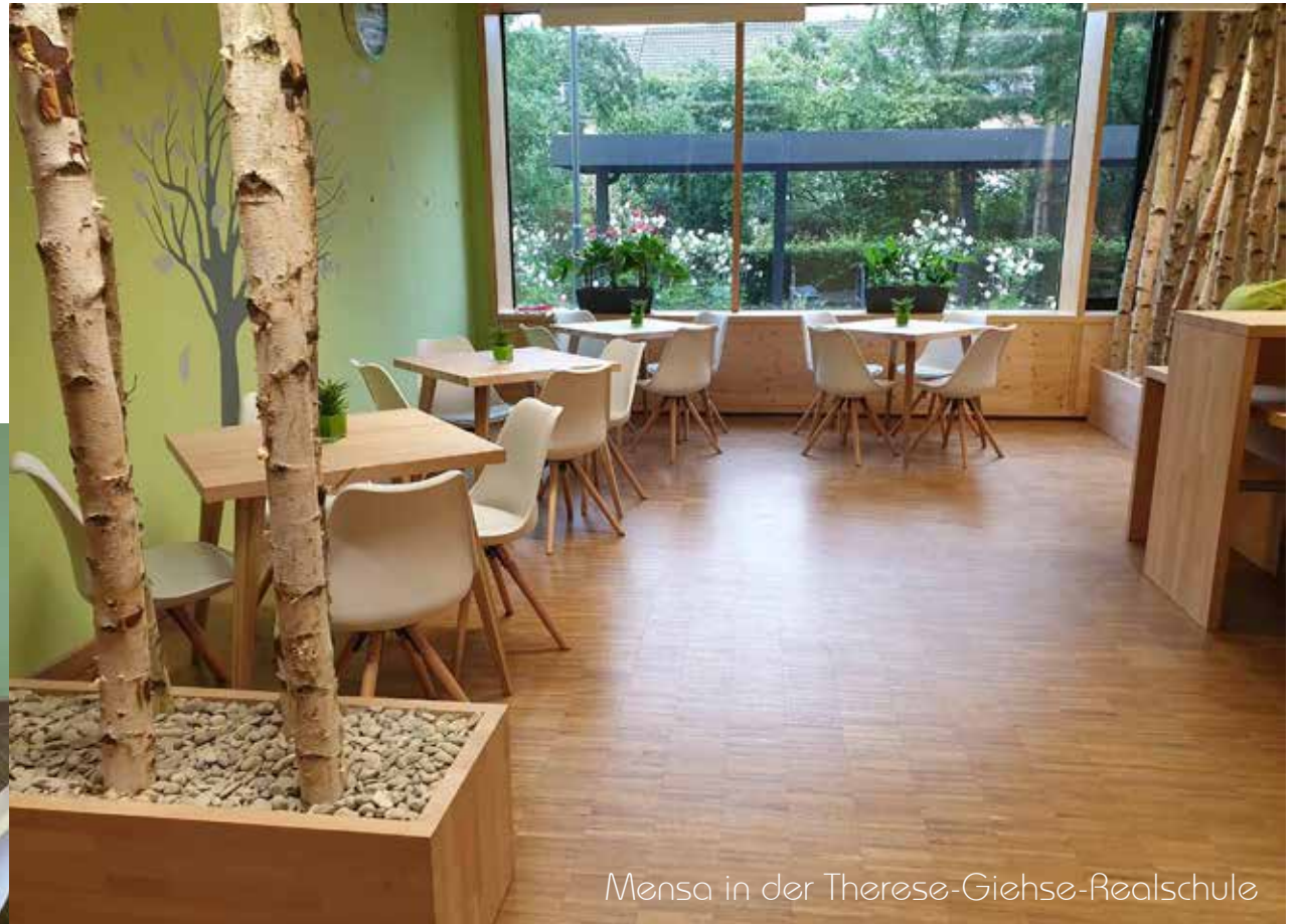
Mensa in der Therese-Giehse-Realschule