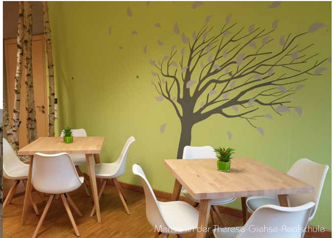
Mensa in der Therese-Giehse-Realschule