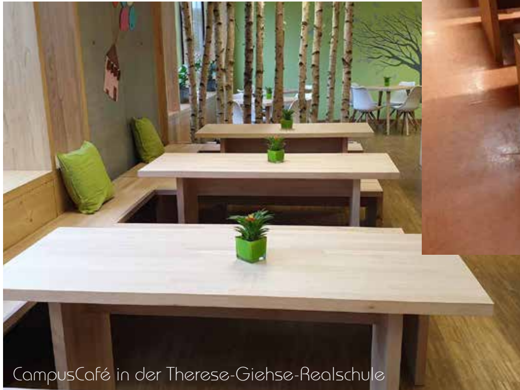
CampusCafé in der Therese-Giehse-Realschule