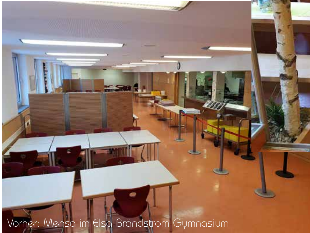
Vorher: Mensa im Elsa-Brändström-Gymnasium

Zweckmässigkeit allein reicht nicht. Niemand setzt sich IRGENDWO hin zum Essen, nur weil er/sie Hunger hat.