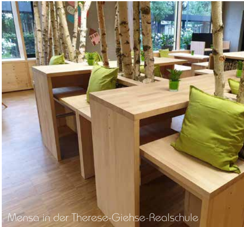
Mensa in der Therese-Giehse-Realschule