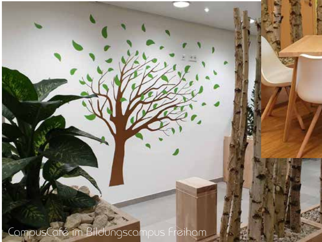
CampusCafé im Bildungscampus Freiham