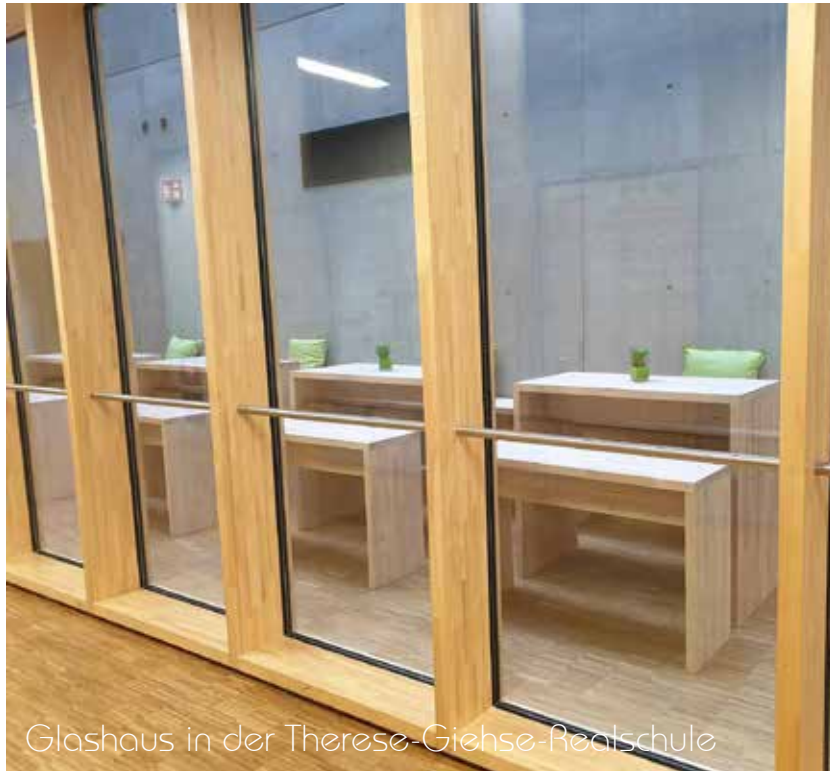
Glashaus in der Therese-Giehse-Realschule

Die HochtischGalerie vermittelt ein Lebensgefühl wie im Strassencafé