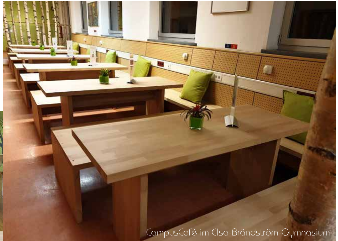
CampusCafé im Elsa-Brändström-Gymnasium