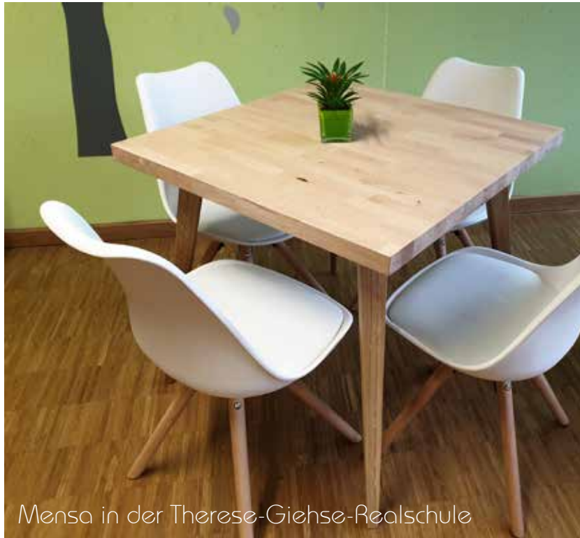
Mensa in der Therese-Giehse-Realschule