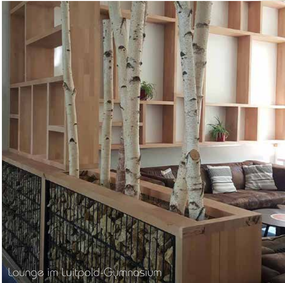
Lounge im Luitpold-Gymnasium