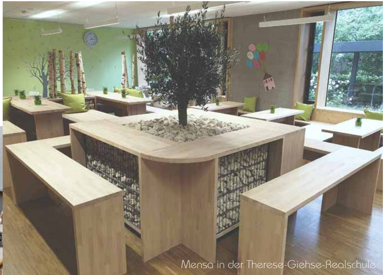
Mensa in der Therese-Giehse-Realschule