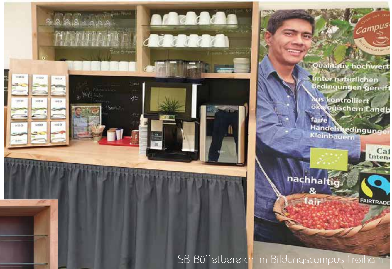
SB-Büffetbereich im Bildungscampus Freiham