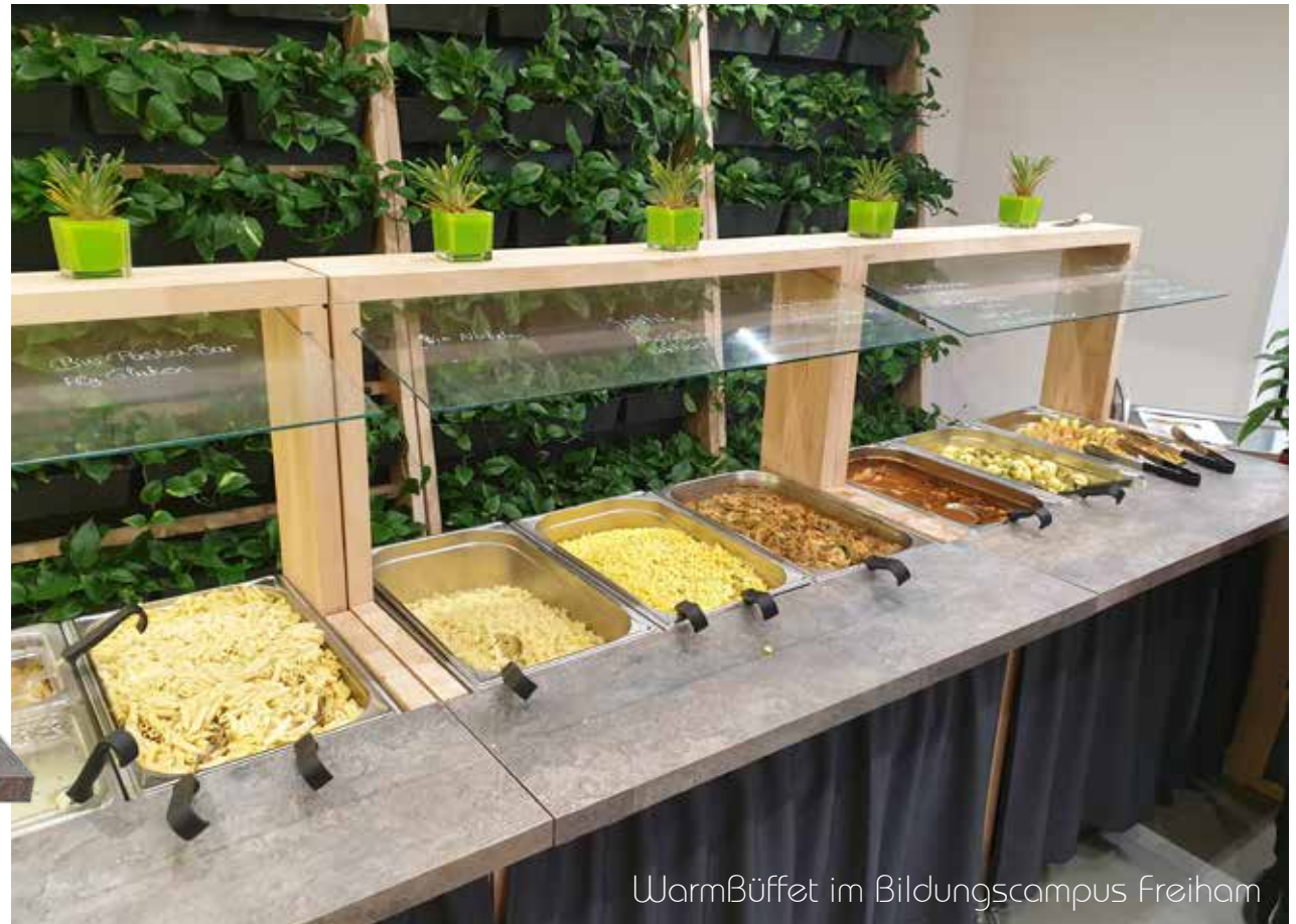
Warmbuffet im Bildungscampus Freiham