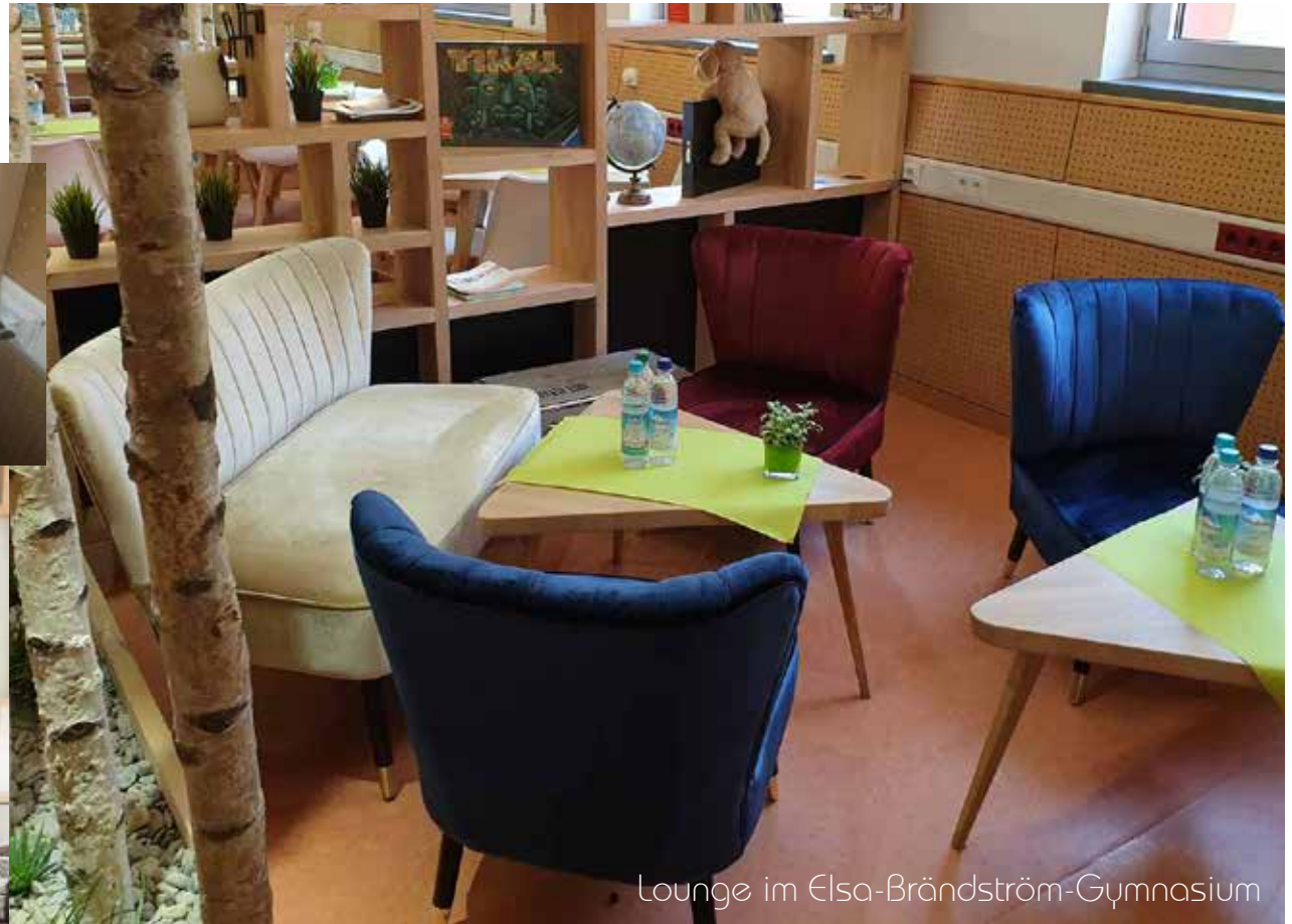
Lounge im Elsa-Brändström-Gymnasium