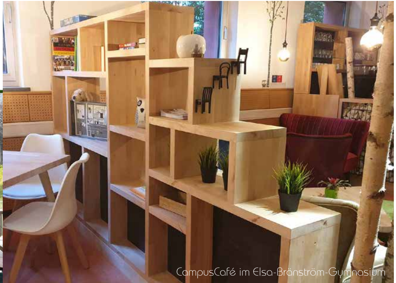
CampusCafé im Elsa-Bränström-Gymnasium

feststehend , in verschiedenen Längen und Höhen lieferbar frei wählbare Facheinteilungen