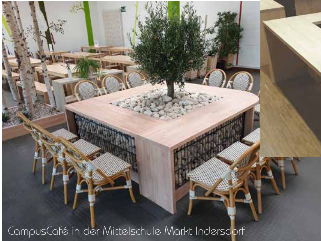
CampusCafé in der Mittelschule Markt Indersdorf