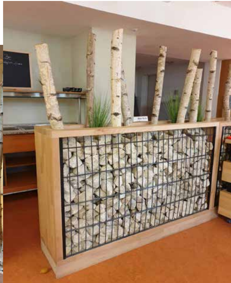
Gabione-BaumTrog mit Birken (hoch)