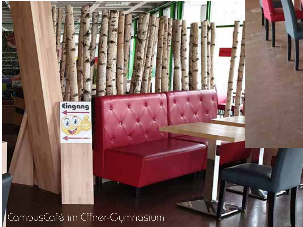
CampusCafé im Effner-Gymnasium