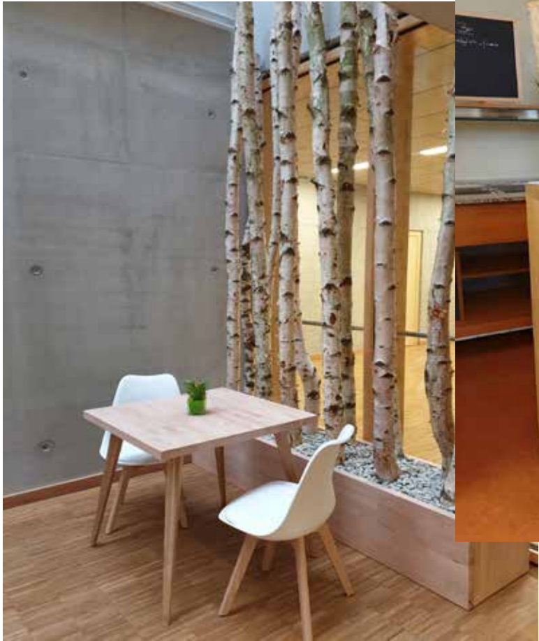
BaumTrog mit Birken (niedrig)