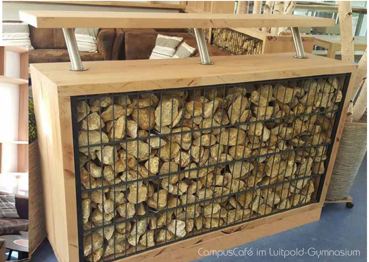
CampusCafé im Luitpold-Gymnasium