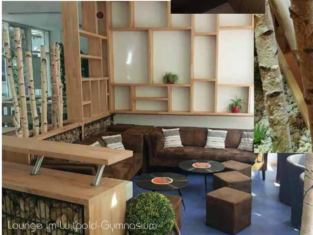
Lounge im Luitpold-Gymnasium