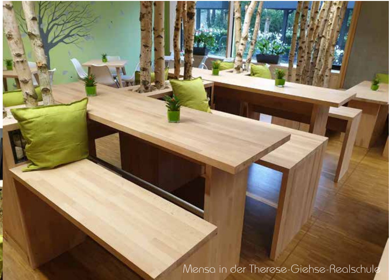
Mensa in der Therese-Giehse-Realschule

... innen für Gruppen ... aussen stylisch quer zur Essrichtung sitzen