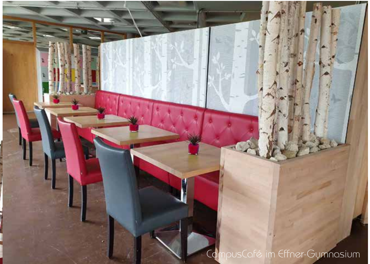
CampusCafé im Effner-Gymnasium