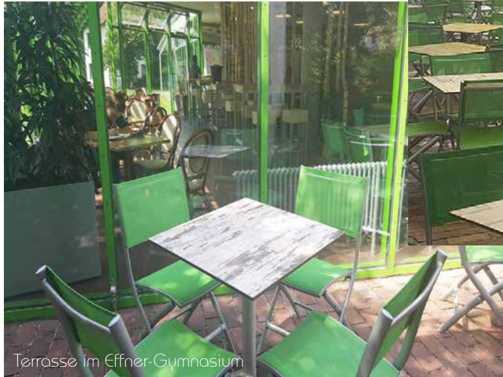
Terrasse im Effner-Gymnasium