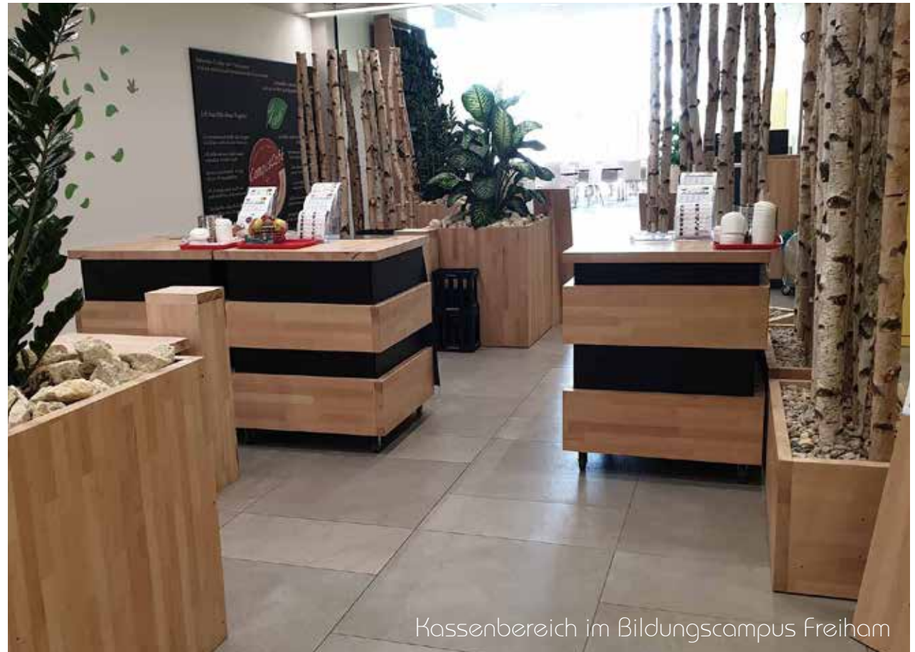
Kassenbereich im Bildungscampus Freïham